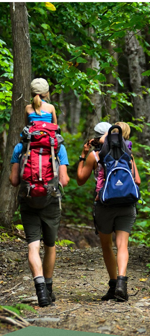
Parc national du Lac-Témiscouata